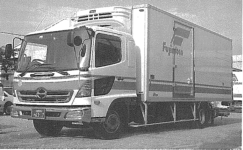
フジモト運輸の主力となる異温度帯共同配送の2層式の冷凍車